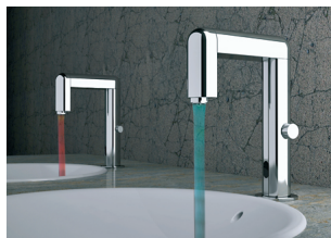
Robinet électronique lumineux