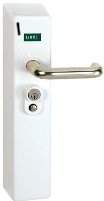
Serrure à monnayeur réf. SP-10