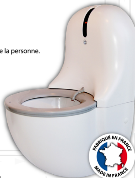
NOUVEAU DESIGN SUP1500

Aspiration temporisée pour une évacuation performante des mauvaises odeurs. Fonctionne en 9v ou 12v en fonction du choix volumétrique d'aspiration de l'air.