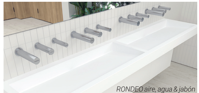
RONDEO aire, agua & jabón