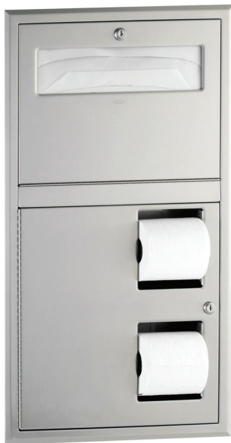
Réf. B0-3474 côté gauche du WC (assis)