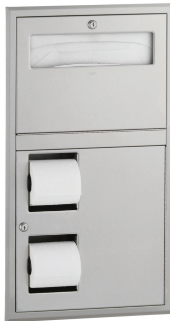
Réf. B0-34745 côté droit du WC (assis)