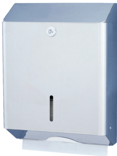
EM-03 finition inox brossé