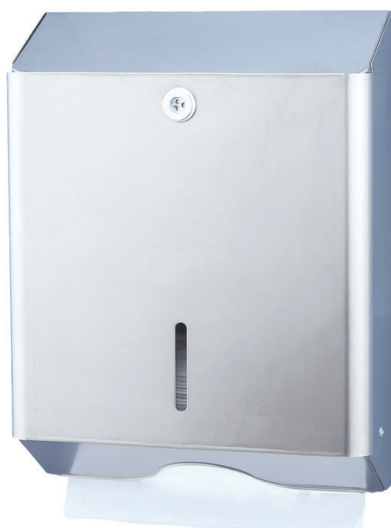
EM-03B finition inox brillant

Distributeur essuie-mains professionnel en inox, avec fenêtre de contrôle du remplissage.