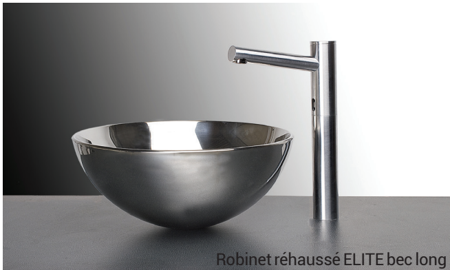
Robinet réhaussé ELITE bec long